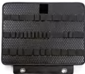
示例图像 | example image