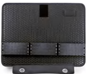
示例图像 | example image