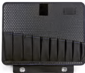
示例图像 | example image