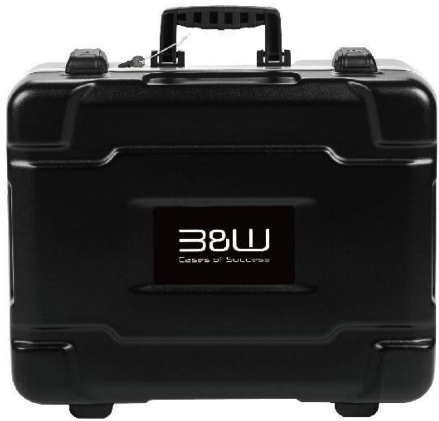
*测试方法因安全箱尺寸不同而有差异

这不仅仅是一款箱子, 它是专业领域的得力伙伴, 是您值得信赖的坚实屏障。B&W Universal.cases, 专业, 就该如此无所不能。